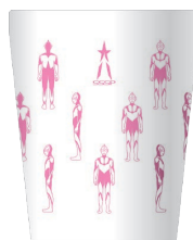
D WHITE × PINK