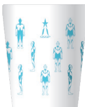
C WHITE × BLUE