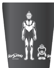
A BLACK × WHITE