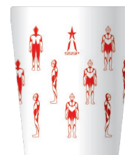
E WHITE × RED