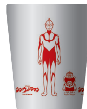
B SILVER × RED